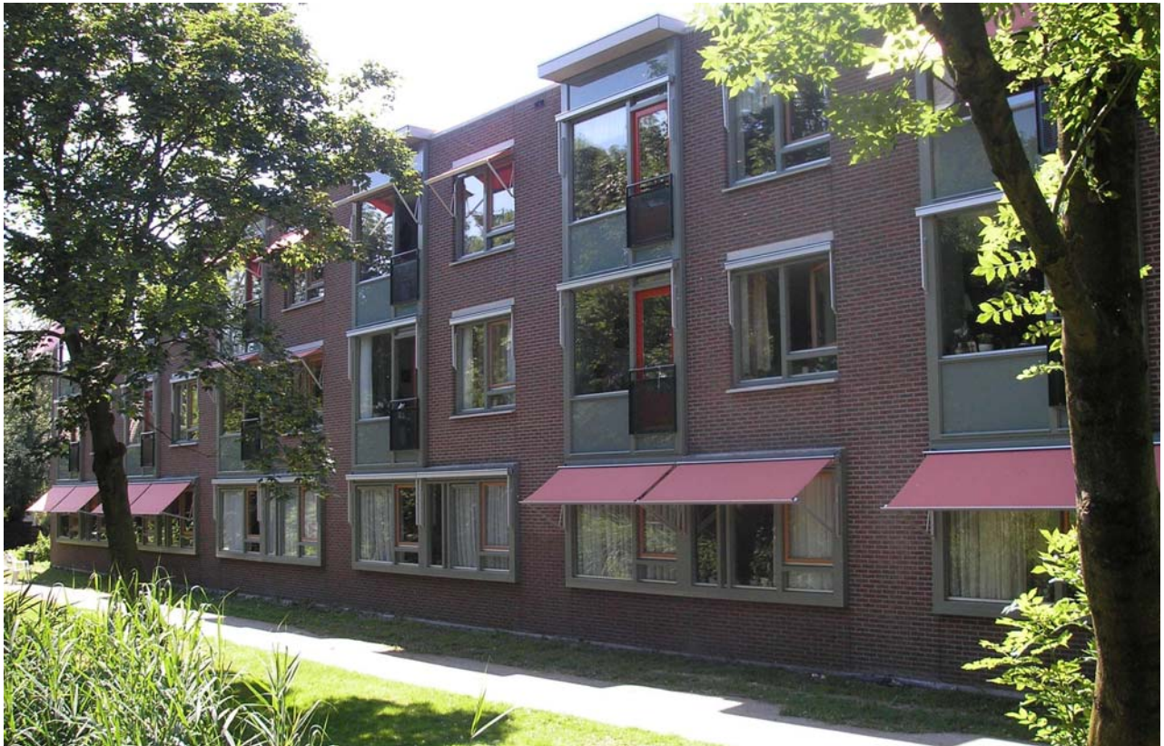
De voltooide oostgevel van het bouwdeel gerealiseerd in fase 1 van de bouw