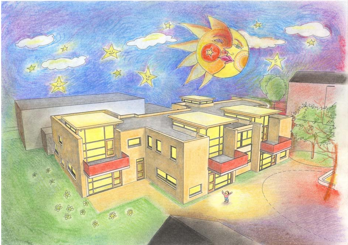
Perspectieftekeningen van het schetsontwerp