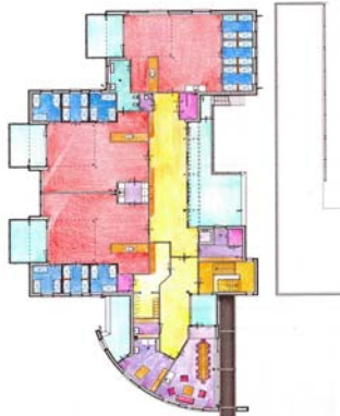
< Plattegrond 1 e verdieping met 3 babygroepen