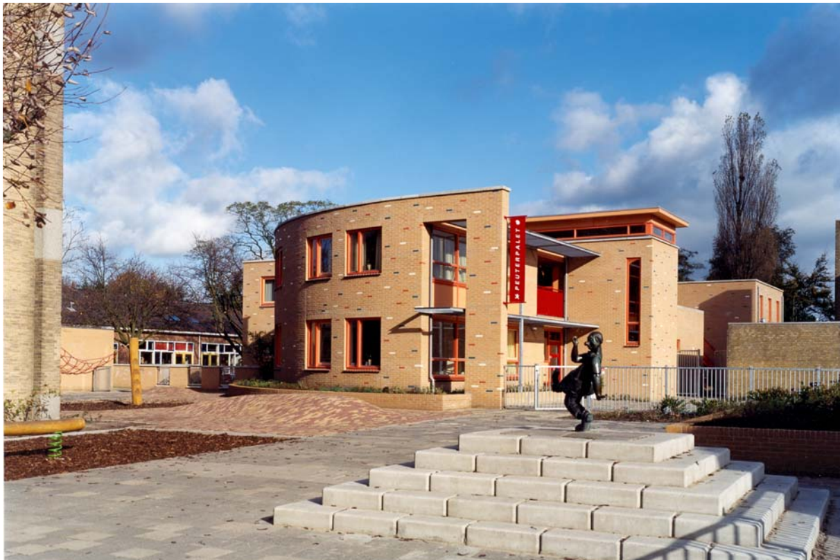
Het speelplein, de zuidoost gevel en de hoofdentree

De krappe locatie maakte het noodzakelijk in twee lagen te bouwen. Peuters spelen veel buiten, deze zijn in drie groepen op de begane grond ondergebracht. De drie babygroepen bevinden zich op de eerste verdieping en hebben ieder een groot balkon en een gemeenschappelijk balkon als buitenterrein. Het aantal vierkante meters voor het buitenterrein was zeer gering. Het bleek een lastige opgave om een geslaagde oplossing uit te werken voor de buitenruimte, veilige speelterreinen voor peuters en kinderen van diverse leeftijden, ook voor de kinderen van de aangrenzende openbare lagere school, een zachte bodem onder de speeltoestellen, veel groen en (klim)bomen. Als speels, decoratief element zijn verschillende kleuren geglazuurde bakstenen in sommige gevels verwerkt.