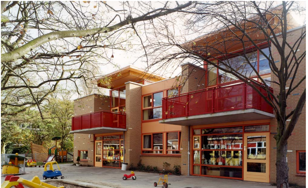
De westgevel met de babybalkons op het noorden, in de schaduw en verhoogde daken voor toetreding van meer daglicht in de speelruimten