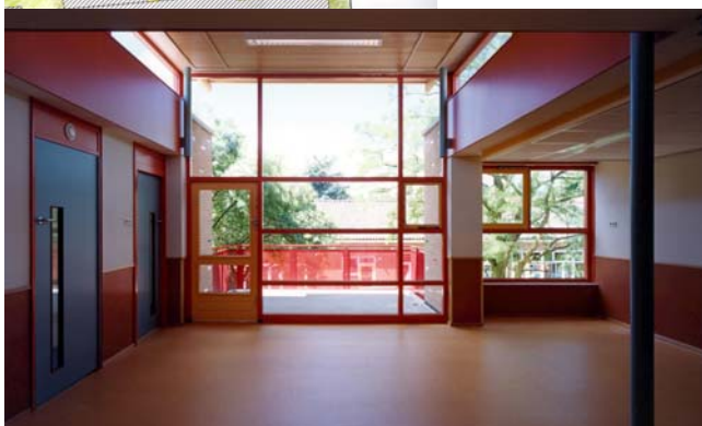
< Een babyspeelruimte