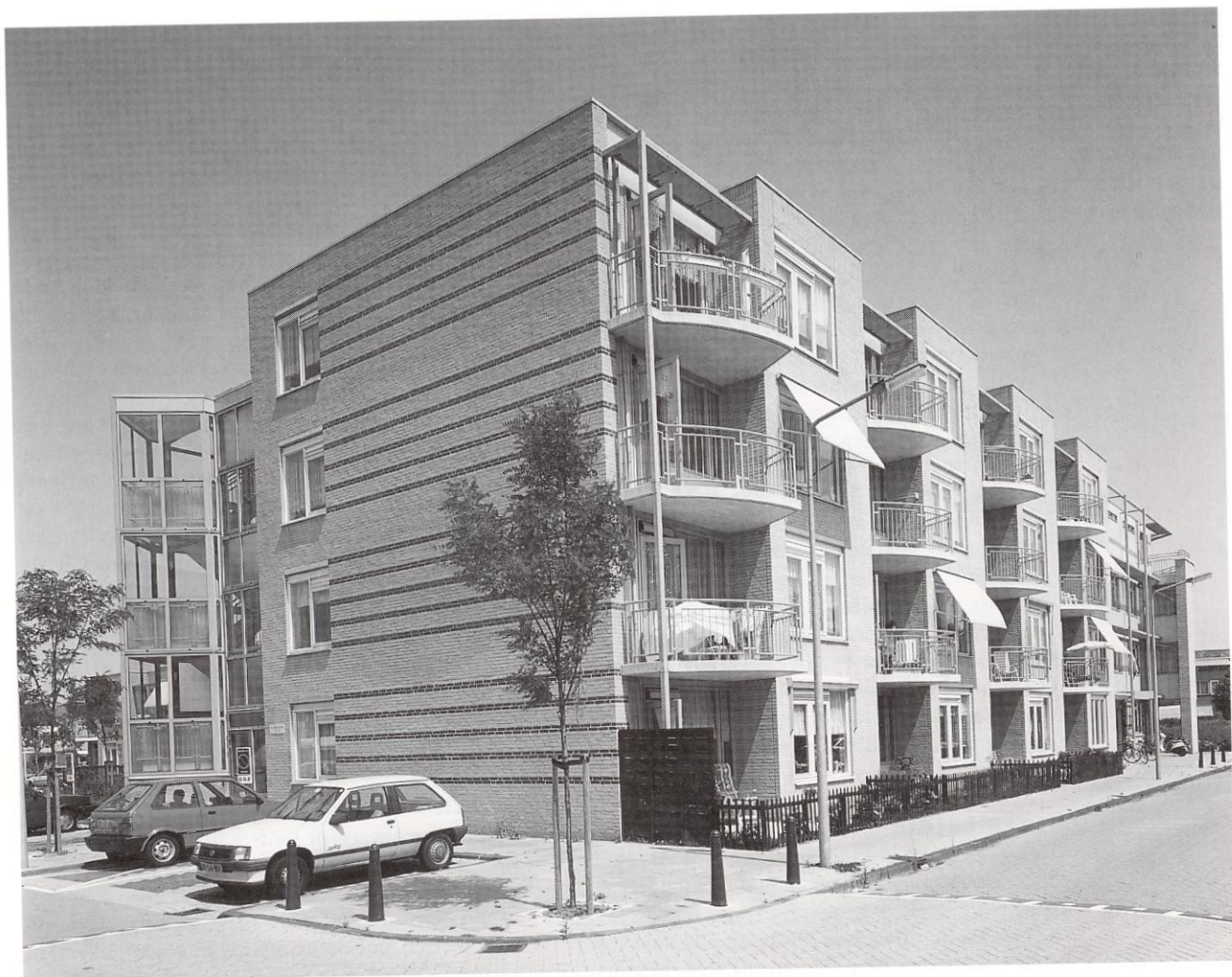
'Zijloever' - woningen voor ouderen, onderdeel van de wijkvoorzieningen voor bejaarden volgens het principe 'Zorg op maat' in Leiden, 1990.